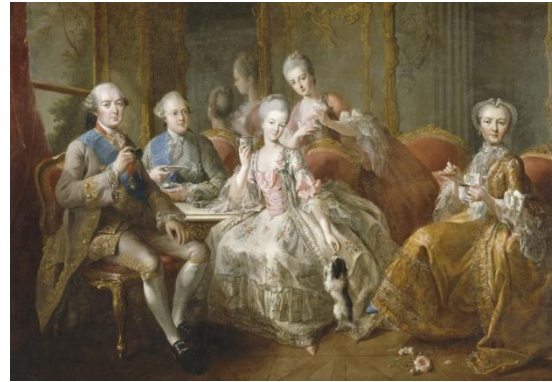
Jean Baptiste Charpentier le Vieux, La famille du duc de Penthièvre , 1768, huile sur toile, 176 x 256 cm, Château de Versailles