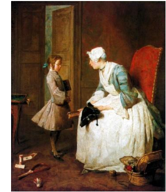
Jean Siméon Chardin, La gouvernante , 1739, huile sur toile, 47 x 38 cm, Musée des Beaux Arts du Canada (Ottawa)