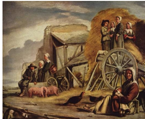
Louis le Nain, La charrette , 1641, huile sur toile, 52 x 72 cm; Musée du Louvre