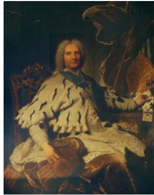
Hyacinthe Rigaud, Portrait du Cardinal de la Tour d'Auvergne , 1732, huile sur toile, 142 x 130 cm, Collection privée