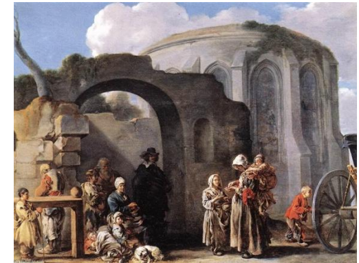
Sébastien Bourdon, Les Mendiants , 1635, huile sur toile, 49 x 65 cm, Musée du Louvre

Nous ne pourrions vivre ensemble en égalité de condition ; ainsi il faut par nécessité que les uns commandent et que les autres obéissent. Les souverains, seigneurs, commandent à tous ceux de leurs états, adressent leurs commandements aux grands, les grands aux médiocres, les médiocres aux petits, et les petits au peuple. Et le peuple, qui obéit à tous ceux-là est encore séparé en plusieurs ordres ou rangs. (...) Les uns sont dédiés particulièrement au service de Dieu ; les autres à conserver l'Etat par les armes, les autres à le nourrir et maintenir par les exercices de la paix. Ce sont les trois ordres ou Etats généraux.