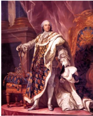
Louis Michel van Loo, Louis XV, roi de France et de Navarre , 1760, huile sur toile, 198 x 142 cm, Château de Versailles