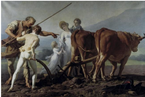
Vincent François André, La leçon de labourage , 1798, huile sur toile, 213 x 313 cm, Musée des Beaux Arts (Bordeaux).