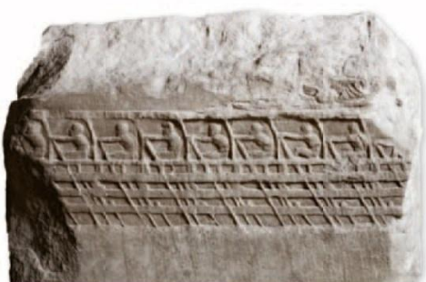
Une trière athénienne

Bas-relief, v. 410-400 av. J.-C., Musée de l'Acropole, Athènes (Grèce).