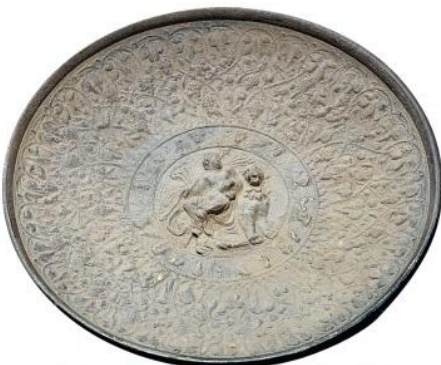
Le dieu grec Dionysos représenté sur un plat en argent doré, II e ou III e siècle après J.-C., trouvé à Lanzhou, en Chine. Musée de la Province de Gansu, en Chine.

Cet objet provient d'une province orientale de l'Empire romain et a été transporté par la route de la soie.