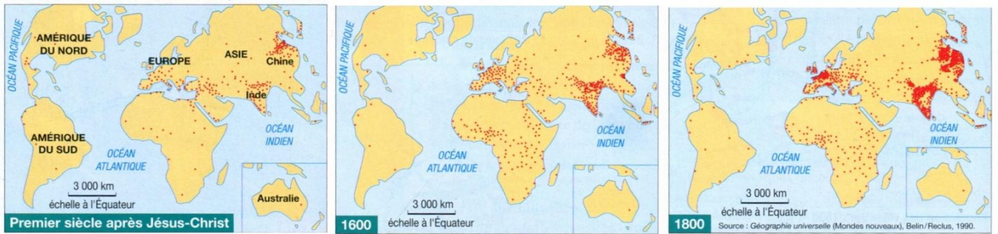
• un million d'habitants DOC. 1 L'évolution du peuplement

1. En observant ces trois cartes, peux-tu dire depuis quand l'Asie de l'Est est-elle peuplée ?