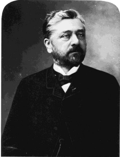
Gustave Eiffel photographié par Nadar (1888)