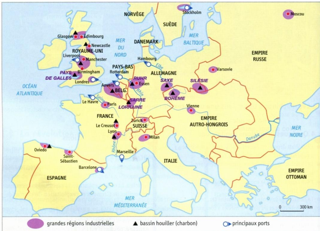
▲ L'industrialisation de l'Europe à la fin du XIX ème siècle

Entoure sur la carte ci-dessous l'espace industriel qui a permis la Tour Eiffel.