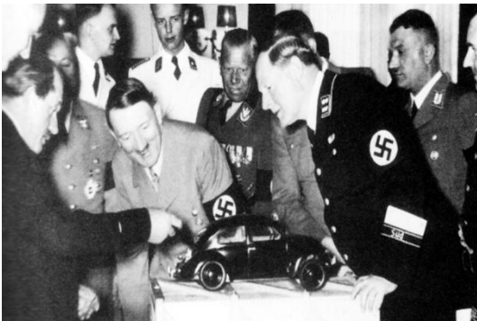
▲ Porsche présente à Hitler la première "voiture du peuple" : Volkswagen en 1938

Quelle est la doctrine promue par Hitler ? Comment prétend-il organiser l'Allemagne et sa société ?